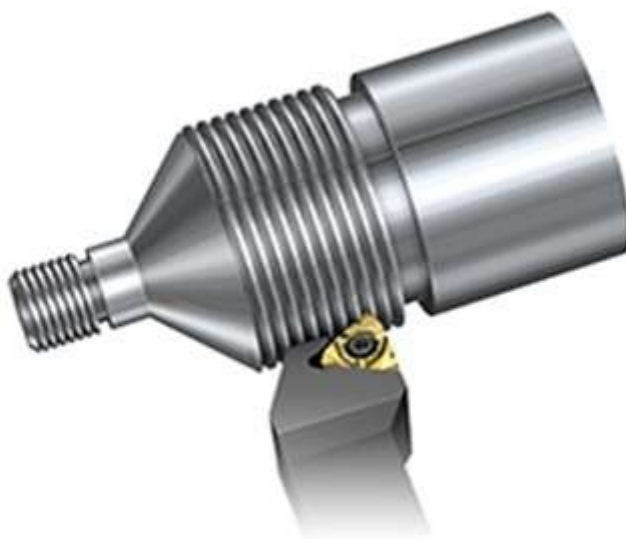
Toczenie gwintu – nóż z wymienną wieloostrową płytką

https://www.youtube.com/watch?v=vxgchzehMGU – Tokarka nacinanie gwintu nożem tokarskim