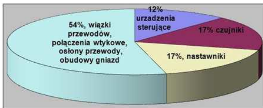
Rys. 1 Procentowe określenie awaryjności komponentów układów elektronicznych w samochodzie

Wszelkiego rodzaju wtyki i złącza mają łącznie około 3000 styków. W samych tylko drzwiach kierowcy biegnie do 50 różnych przewodów i mikro wyłączników, silników centralnego zamka, silnika zamykania i otwierania okna, jego przycisków sterujących, przycisków sterujących otwieraniem pozostałych okien, przestawianiem obu lusterek zewnętrznych, ogrzewaniem lusterek, zamka w drzwiach, wyłącznika instalacji alarmowej itd.